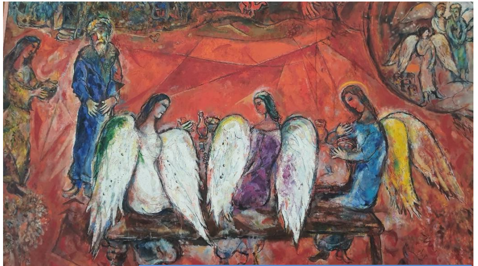
Marc Chagall, "Abramo e i tre angeli", 1935 Musée National Marc Chagall, Nizza.